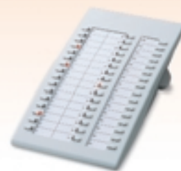
KX-T7740* Consola SDE