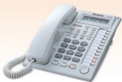
KX-T7730* LCD, Teléfono con altavoz