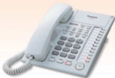
KX-T7750* Teléfono monitor